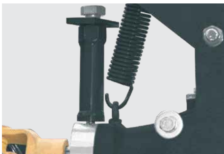
Soporte para nivelación del equipo.