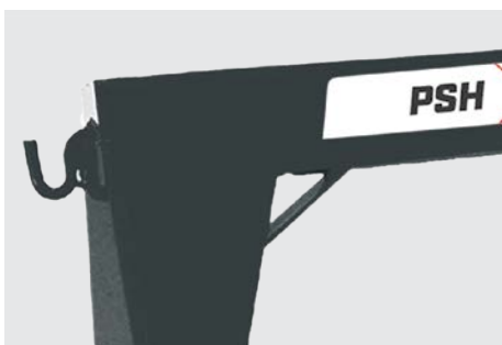
Estructura con vigas tubulares de acero.