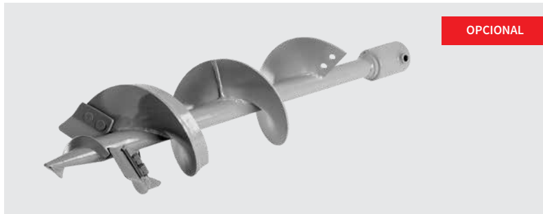
Barrenas de 9", 12" y 18" y PSH sin Barrena.