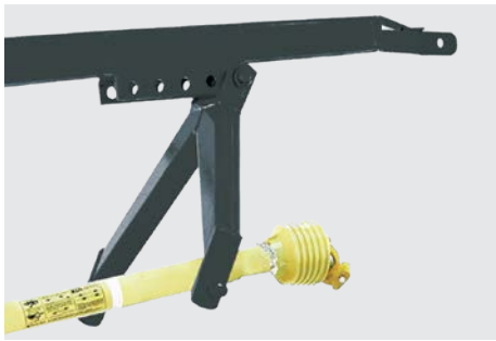
Enganche de 3 puntos, con regulación de altura.